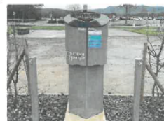
2 bornes accélérées (3,7 à 22 kW) 4 points de charge